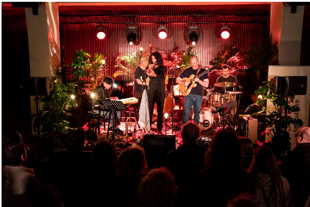
Ashtabiez © Bert Duerinck