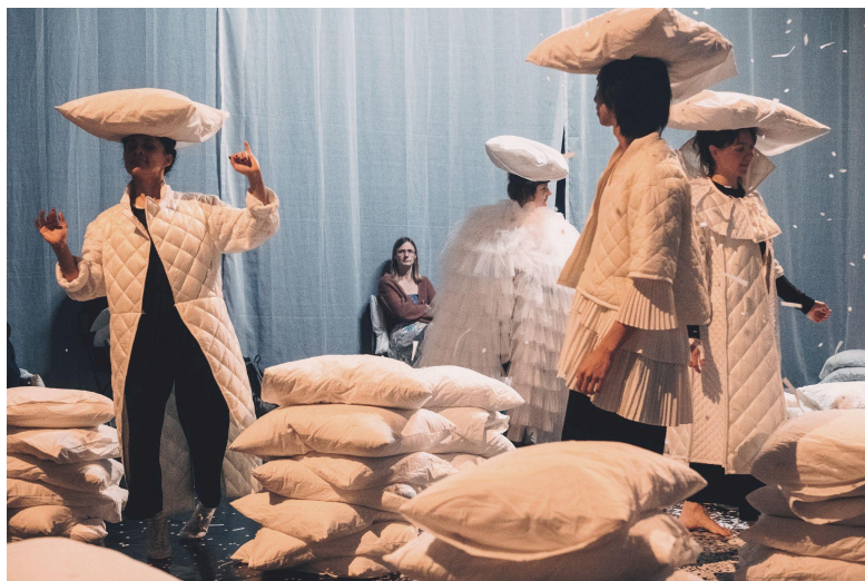
Permit, oh permit my soul to rebel