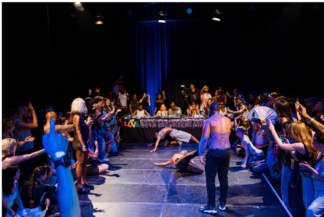
The Summer of Love Ball, 2024