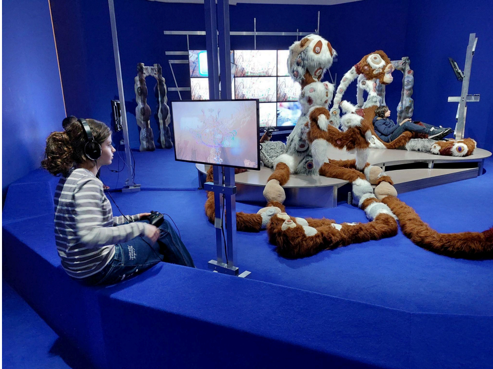
Family Arcades