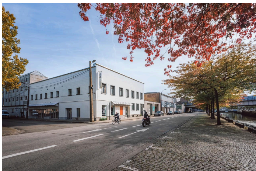
NW Aalst

Gemeenschapswerk krijgt in Lokaal Dendy een tastbare vorm. Activiteiten ontstaan van onderuit, gevoed door ideeën en noden uit de wijk en daarbuiten. NW faciliteert en ondersteunt , maar legt niets op. Van activiteiten voor kinderen, lezingen en spontane ontmoetingen tot een initiatief van Vrede vzw — de ruimte groeit mee met wat leeft.