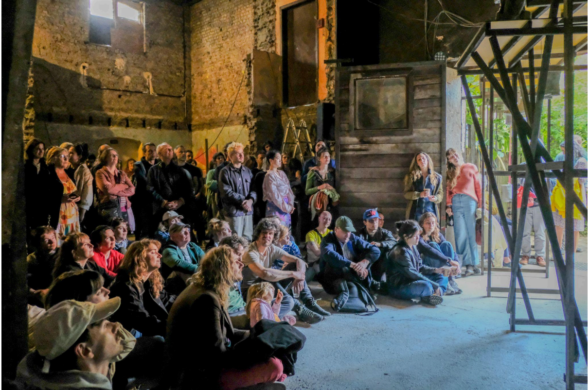
De Koer