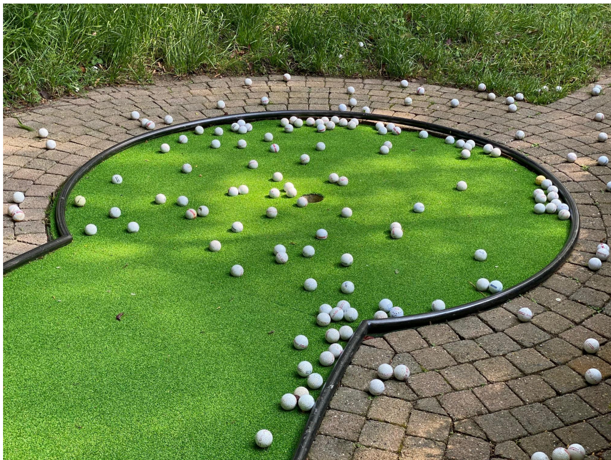
Zonder titel, veel geluk © Miles Fischler