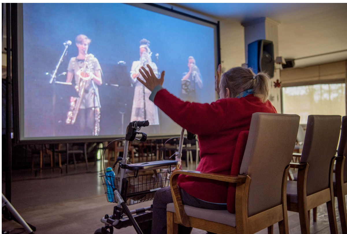
Livestream naar zorgcentra