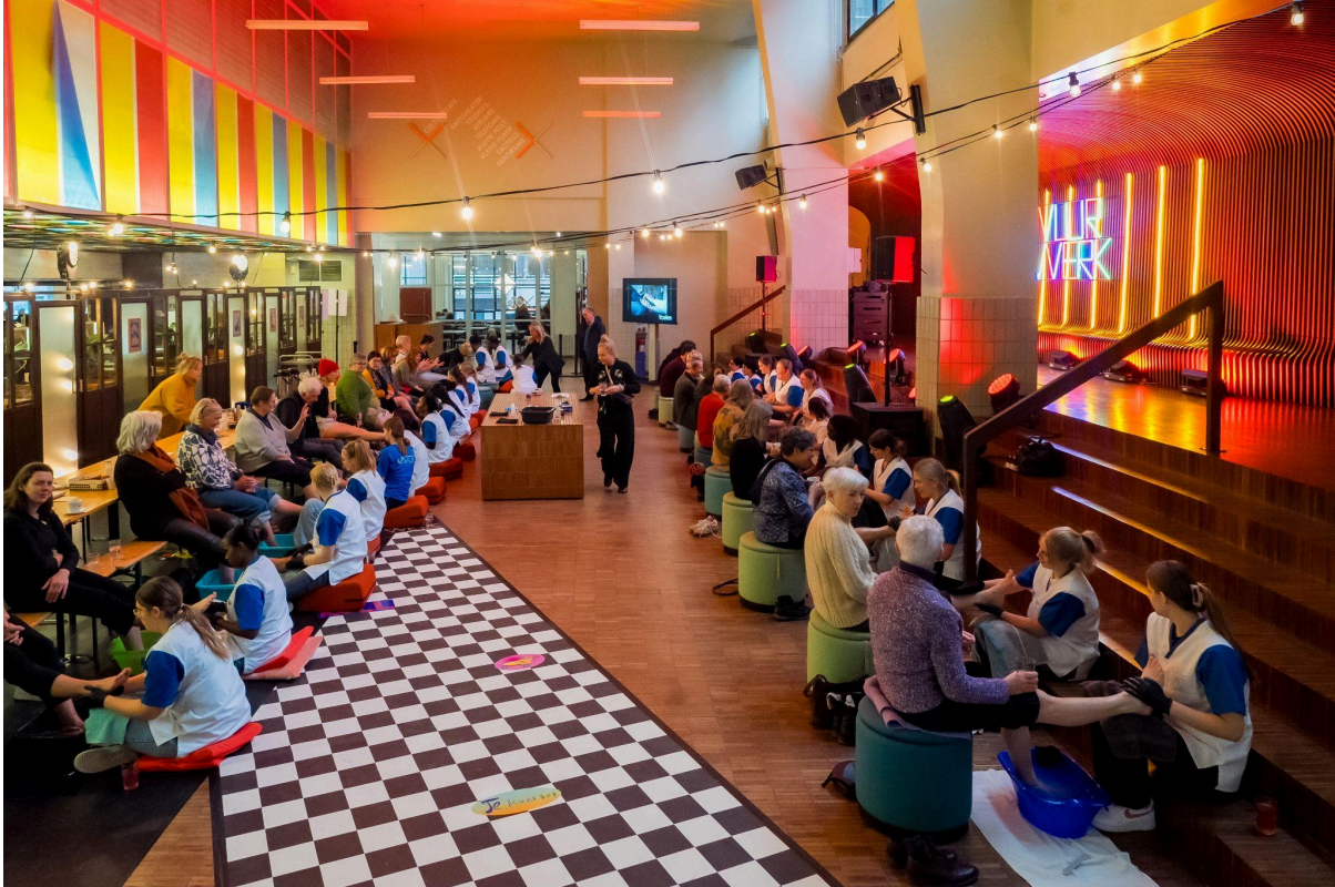
Vrolijke voeten © Yvan Mahieu