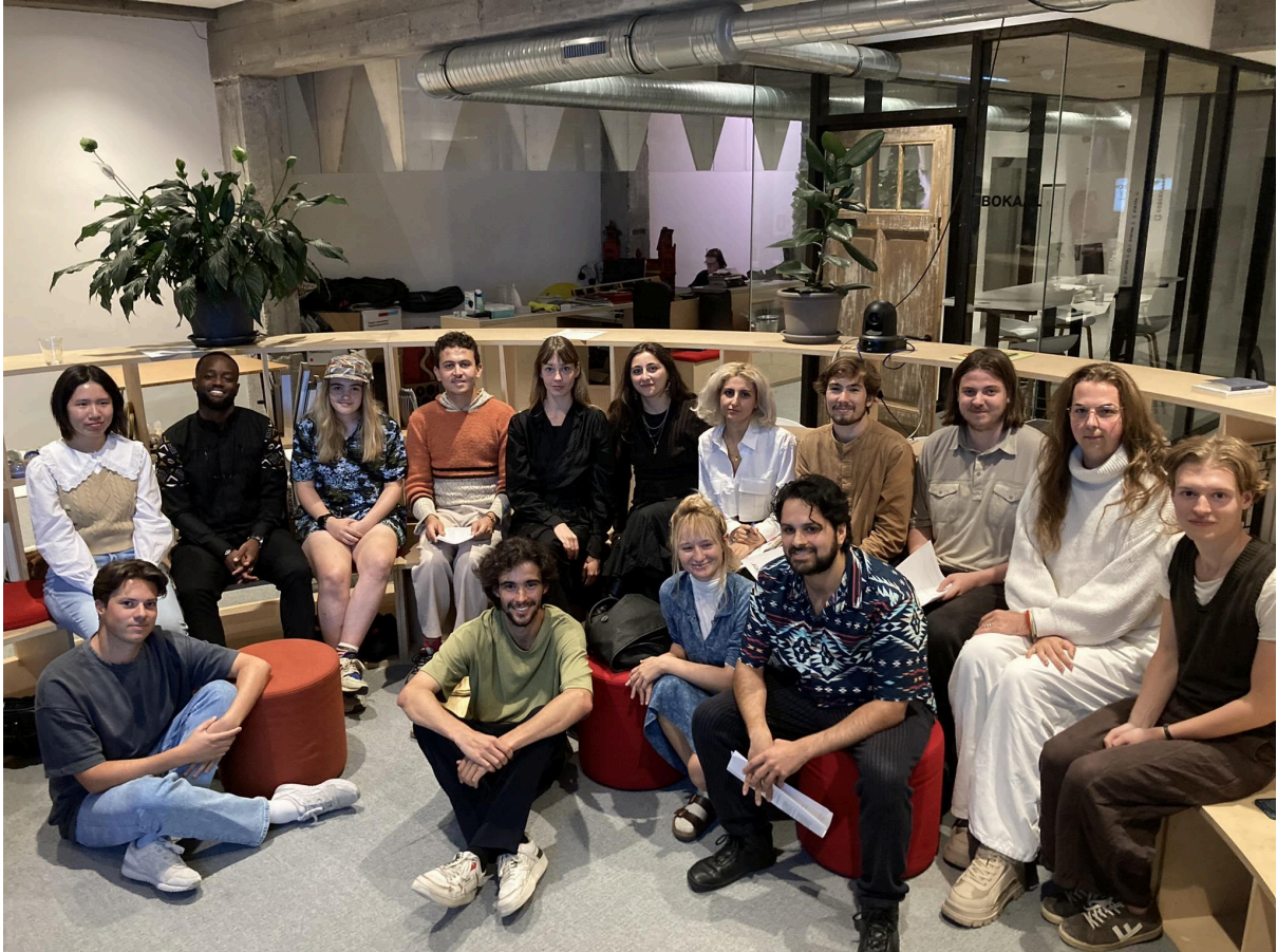
Jong Panel 2023-2024