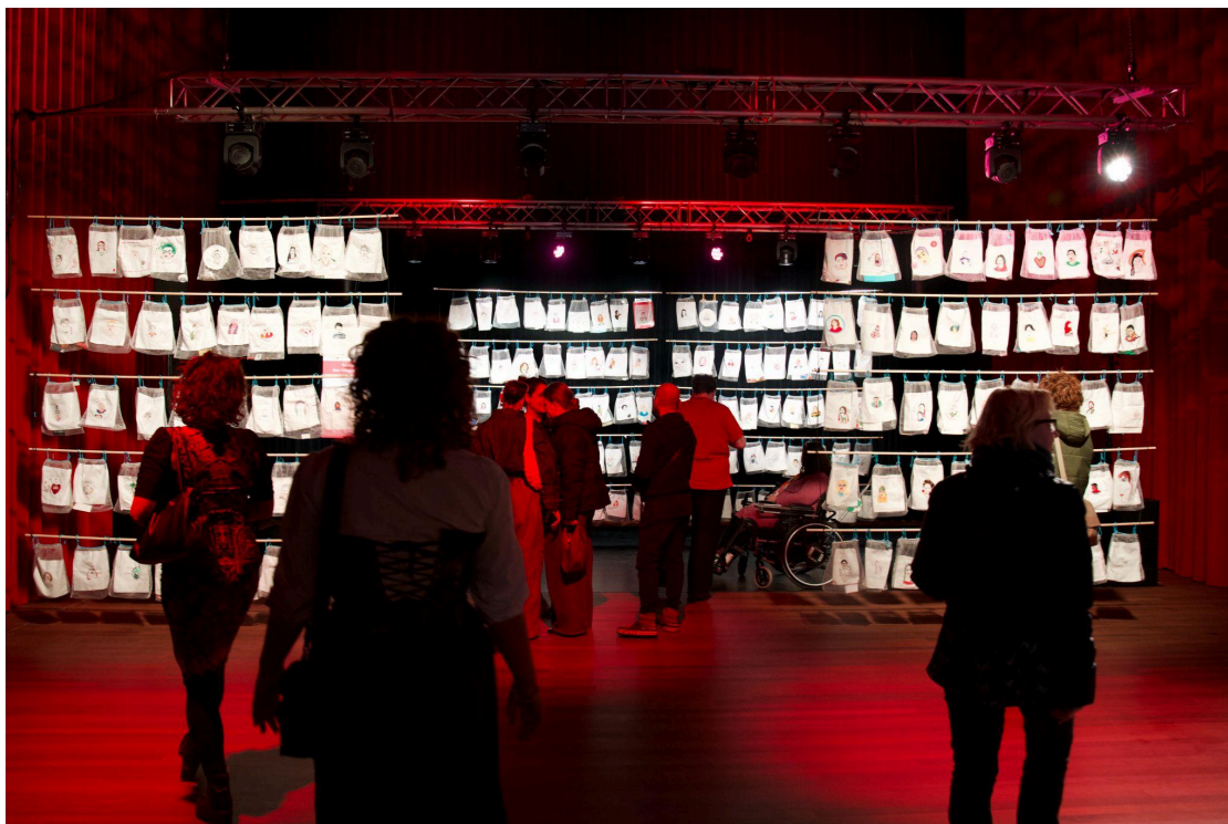
Women Connected X Theater Zuidplein - Internationale Vrouwendag

Hun programma werken ze vaak uit in samenwerking . Er zijn bijvoorbeeld samenwerkingen met groepen en gemeenschappen in de buurt. Dit is een engagement op lange termijn, zodat beide partijen elkaar goed leren kennen. Een andere vorm van samenwerking die Theater Zuidplein inzet, zijn zogenaamde 'bewonerpanels'. De programma's die daaruit voortvloeien, worden gekenmerkt door herkenning en erkenning.