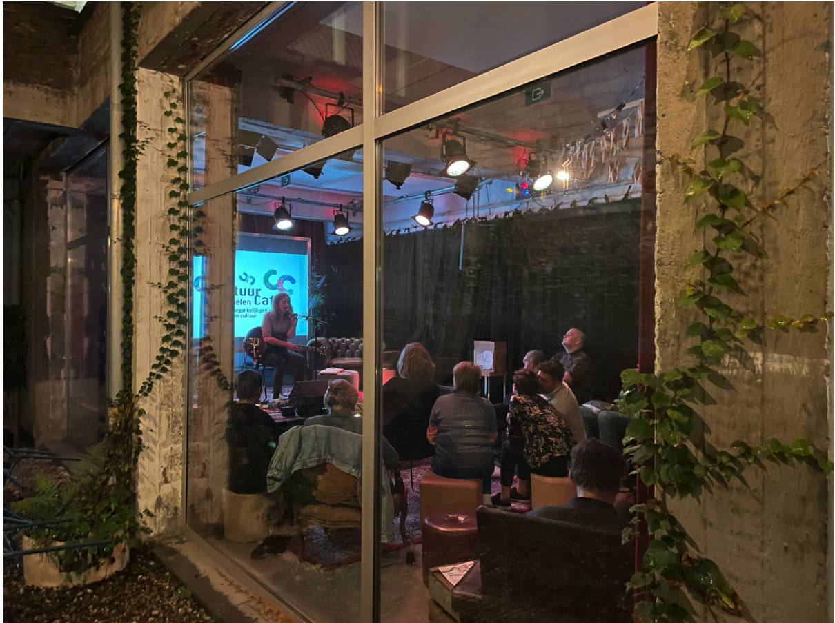
Cultuurcafé Mechelen