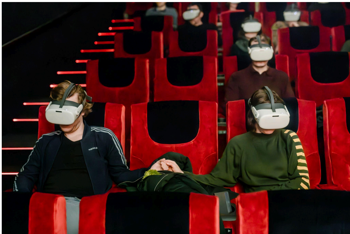
VR Film Screening