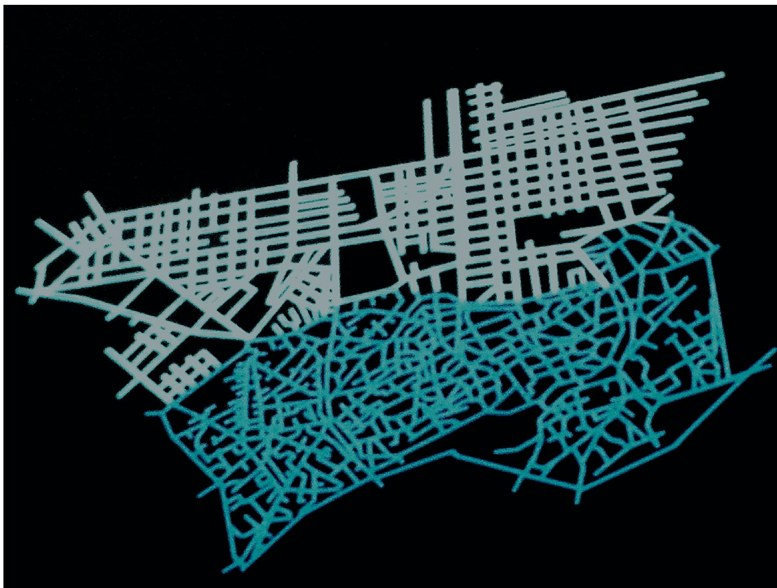
Medina van Tunis (c) Coslett 2017 - Mesa 2016

voor de stad waarin ze leven. Het idee achter dit project was een uitgebalanceerde dialoog op te zetten tussen het rondreizende centrale programma van Meeting Points en de verschillende lokale artistieke realiteiten in Alexandria, Amman, Beiroet, Cairo, Damascus en Tunis. De resulterende projecten waren zeer uiteenlopend in vorm en in de manier waarop ze zich verhielden tot de lokale stedelijke contexten. Samen vormden ze een diepgaande reflectie over de positie van kunstenaars en plaatsgebonden artistieke producties, niet alleen in hun directe relatie met hun publiek, maar ook in verhouding tot de inwoners van de verschillende steden en de specifieke stedelijke en culturele landschappen in de Arabische wereld.