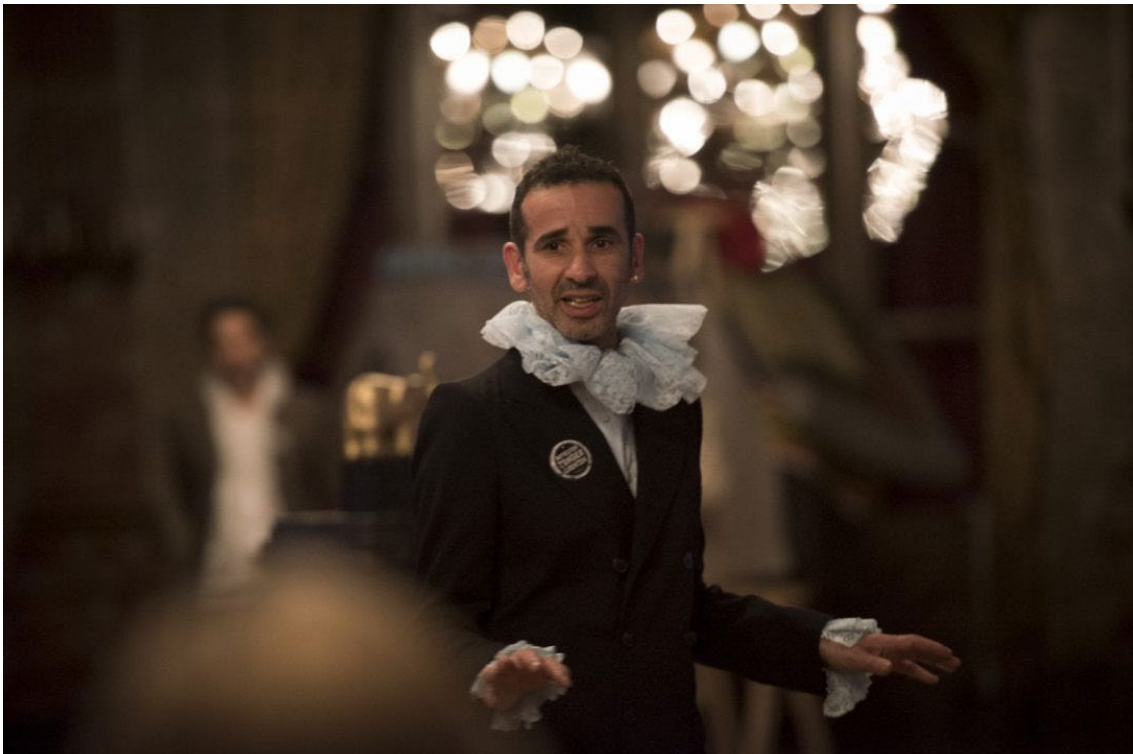
Action Zoo Humain, Join the Revolution (c) Kurt Van der Elst

Verder graven in de archieven van het Unclassified-programma met de vraag hoe het Young Arab Theatre Fund zichzelf zo snel overbodig heeft kunnen maken, zal productief blijken in de vraag naar de rol van organisaties in het van onderuit faciliteren van internationale samenwerkingsverbanden. Maar het ontstaansverhaal dat in deze bijdrage kort werd geschetst, vertelt ons op zich voldoende over hoe in de huidige complexe politieke context kan worden gewerkt aan het verder uitbouwen van transnationale samenwerkingstrajecten tussen kunstenaars en culturele spelers “hier” en “daar”.