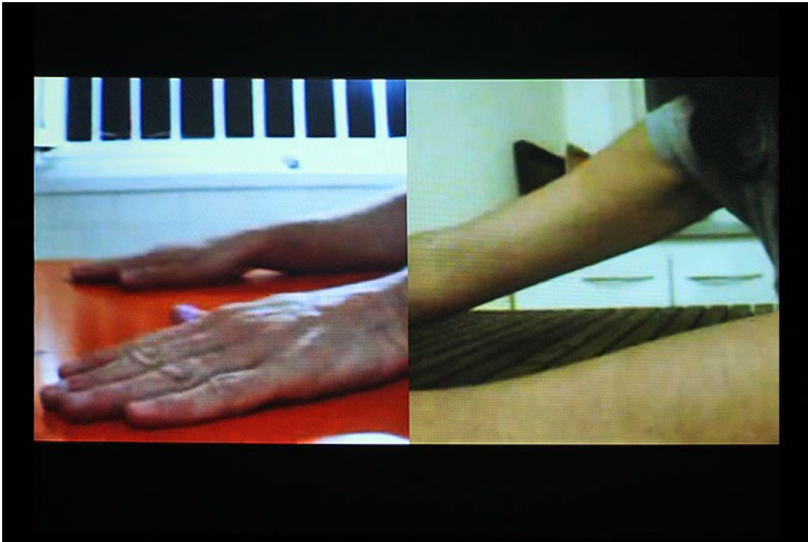
Selma & Sofiane Ouissi, Here(s)

Doorheen deze oefening hoop ik tussen de lijnen mogelijke valkuilen aan te wijzen in het opzetten van internationale projecten met de MENA-regio, vanuit het Europese continent en meer bepaald vanuit Vlaanderen en Brussel.