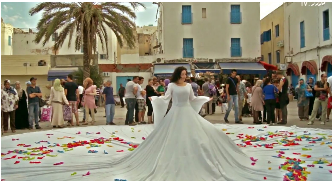
L'Art Rue - Dream City 2012

Het festival werd ontvangen als een verademing in de verstikkende routine van autocratische gehoorzaamheid, maar ook als een heldere opening en een doorbraak in een verder relatief uitzichtloos en gesloten kunstenlandschap.