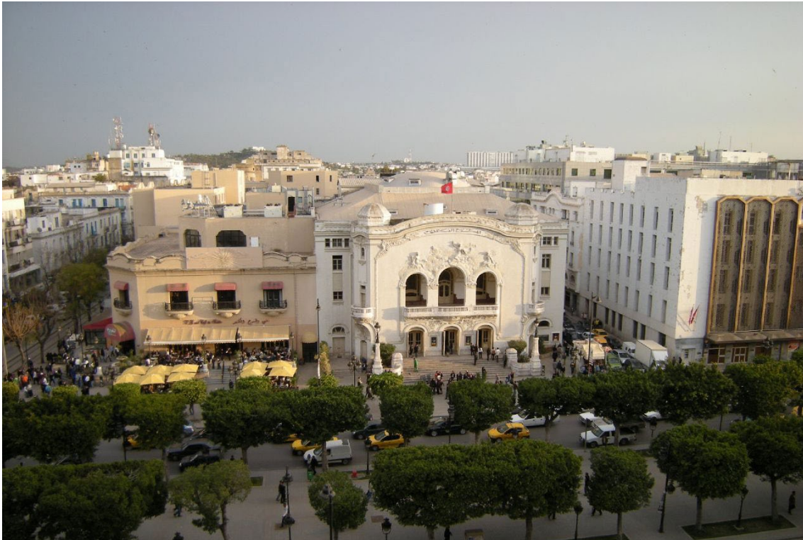
Théâtre Municipal de Tunis