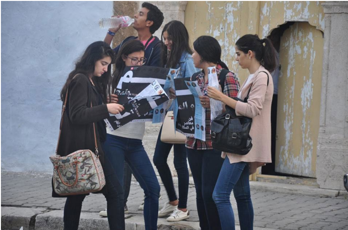
Dream City 2015

De derde editie van het Dream City-festival, daarentegen, omvatte een uitgebalanceerd programma in de uitzonderlijk traditionele publieke ruimte van de medina. Ze wist de seculier-islamistische valkuil op een intelligente manier te transformeren en liet een nieuwe kritische en poëtische derde ruimte tevoorschijn komen waarbinnen de sociale en politieke oorzaken en gevolgen van de revolutie opnieuw overwogen kunnen worden. Om haar autonomie in de publieke ruimte te vrijwaren en politieke instrumentalisering te vermijden, werd het participatieve en inclusieve karakter van het festival verder versterkt.