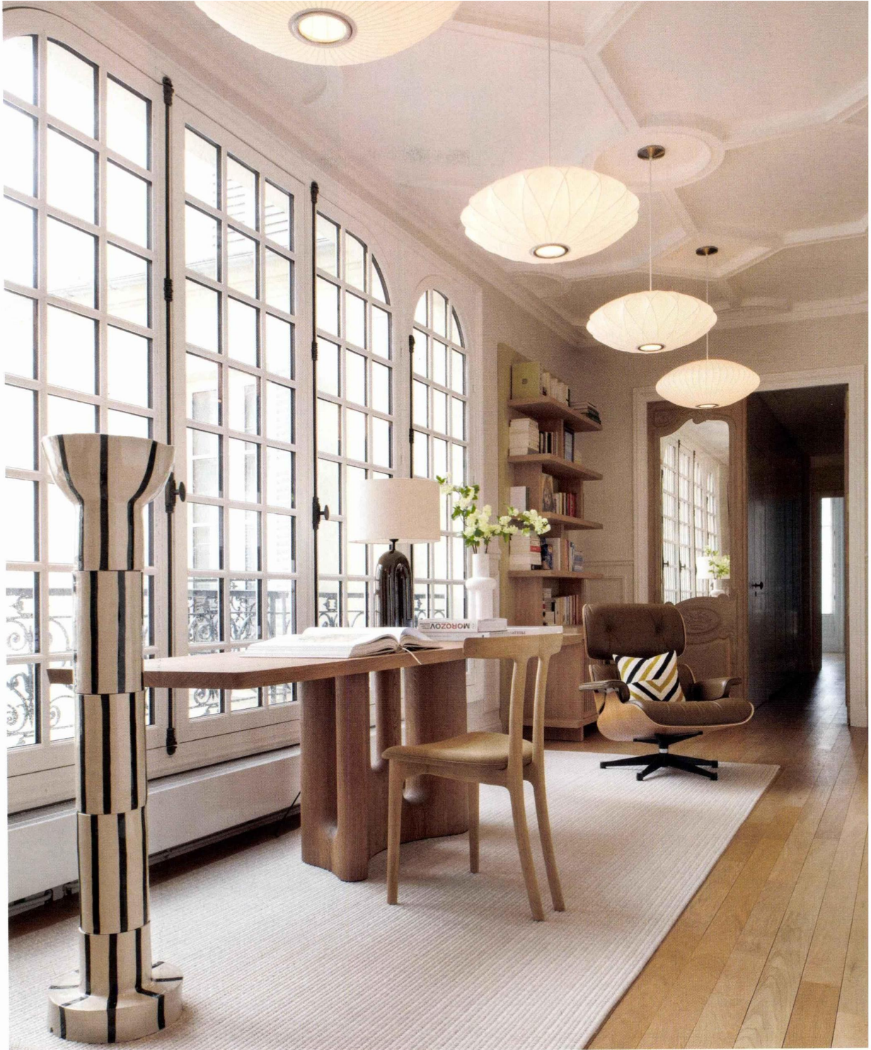
ESPACES TRAVERSANTS L'entrée profite d'une baie vitrée restaurée. Sur la console « Nin » de Christophe Delcourt, lampe « Arko » de Simone & Marcel. Chaise « T-Chair », Carl Hansen & Son. Tapis, Limited Edition. Fauteuil « Lounge Chair » de Charles & Ray Eames, Vitra chez Silvera. Au premier plan, lampadaire totem en céramique, Bom Céramique. Suspensions « Bubble Saucer » de George Nelson, chez Hay. Au fond, bibliothèque dessinée par Double G. PAGE DE GAUCHE La cuisine réalisée sur mesure associe des façades et un îlot en chêne teinté brossé à des plans de travail en lave émaillée. La crédence en miroir apporte de la profondeur. Robinetterie Dornbracht. Applique « Raku regular », Emmanuelle Simon. Rideaux, Pierre Frey. Tabourets « Emea », Alki.