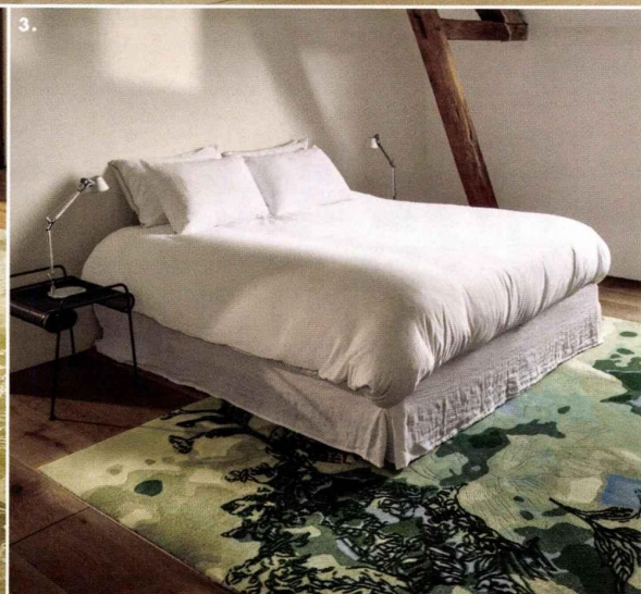
1. Océanique. Tapis tufté « Atoll », qui s'inspire d'un anneau de récifs coralliens, en laine, soie, lin, mohair, viscose et coton, coloris Aqua, existe aussi en Sand et Pale Blush, 250 x 250 cm (dimensions sur mesure, jusqu'à 485 x 990 cm), réf. AOOC20728, Aqua, Organic 9, Limited Edition, 4225 €. 2. Végétal. Tapis noué main « Tile Repeat », collection Botanical, design Studio Glithero, en laine, lin et soie, fabriqué au Népal, 200 x 300 cm (dimensions et couleurs sur mesure), Manufacture Cogolin, à partir de 23508€. 3. Floral. Tapis tufté rectangulaire « Floras Jade », collection Floræ Folium Series, design Sam Baron, en laine surpiquée, 200 x 300 cm, Tai Ping, 7070€. PAGE DE GAUCHE Art déco. Tapis tufté main « Style », découpes en escalier, en laine de Nouvelle-Zélande et soie végétale, existe en deux coloris et trois formats, 170 x 240 cm, 200 x 300 cm et 250 x 350 cm, Toulemonde Bochart, 1450€, 2250€ et 2950€. Adresses page 162