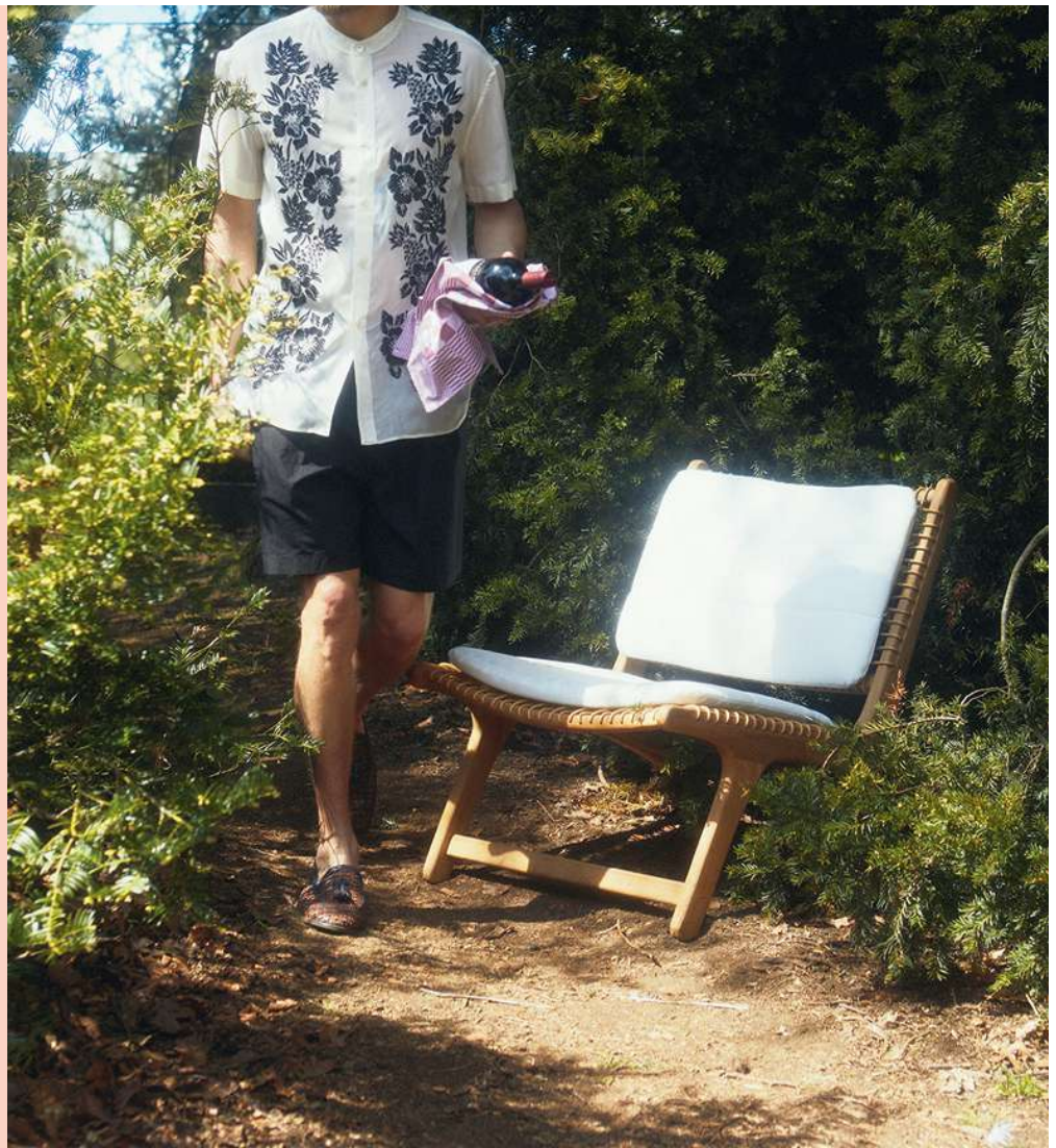
Chemise en soie rebrodée, Saint Laurent @ MyTheresa. Short noir, Christian Wijnants . Loafers en cuir tressé brun et bleu pétrole, Fratelli Rossetti . Essuie vaisselle à carreaux, Dille & Kamille . Fauteuil Cosito en teck et résine tressée, et coussins résistant aux intempéries, Overstock Garden .