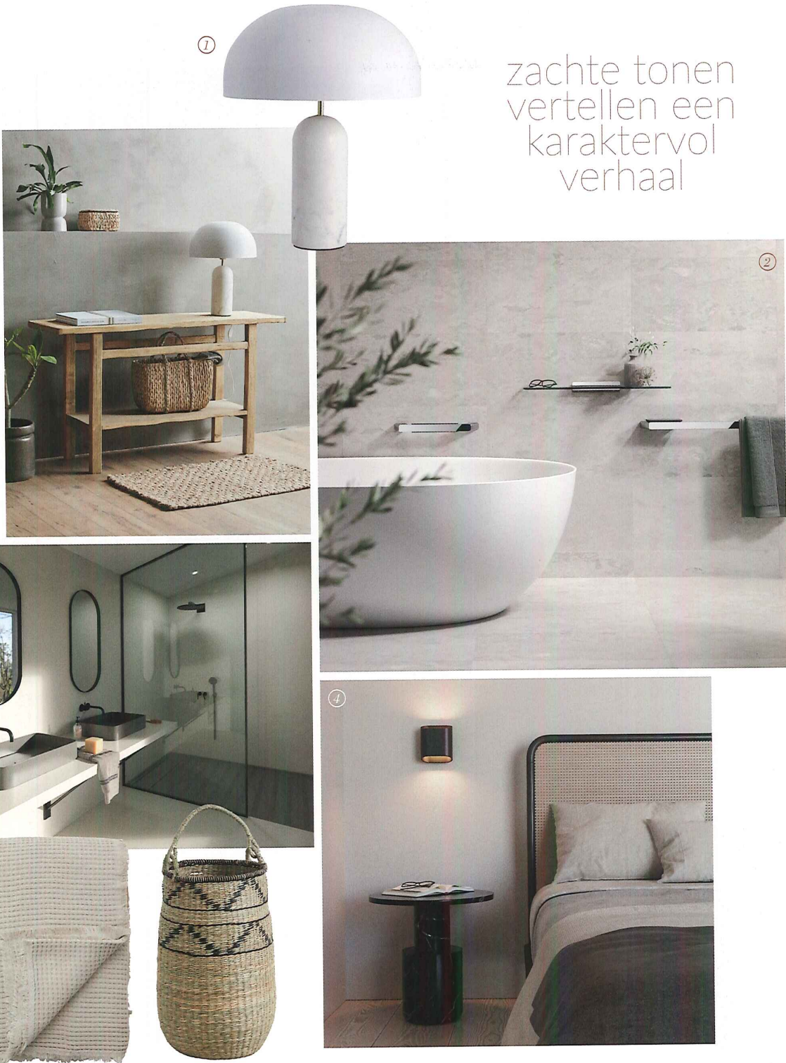
1. Atlas tafellamp met witte marmer Nordal €369 - www.nordal.eu 2. Geesa Shift collectie Chrome prijs op aanvraag www.geesa.com 3. Silestone Faro White Sunlit Days countertop prijs op aanvraag - www.silestones.com 4. Residentieel project Kopenhagen Modular Lighting, Trapz armatuur prijs op aanvraag - www.supermodular.com 5. Alpha bedsprei €169 & Trogir €199 mand Nordal - www.nordal.eu

zachte tonen vertellen een karaktervol verhaal