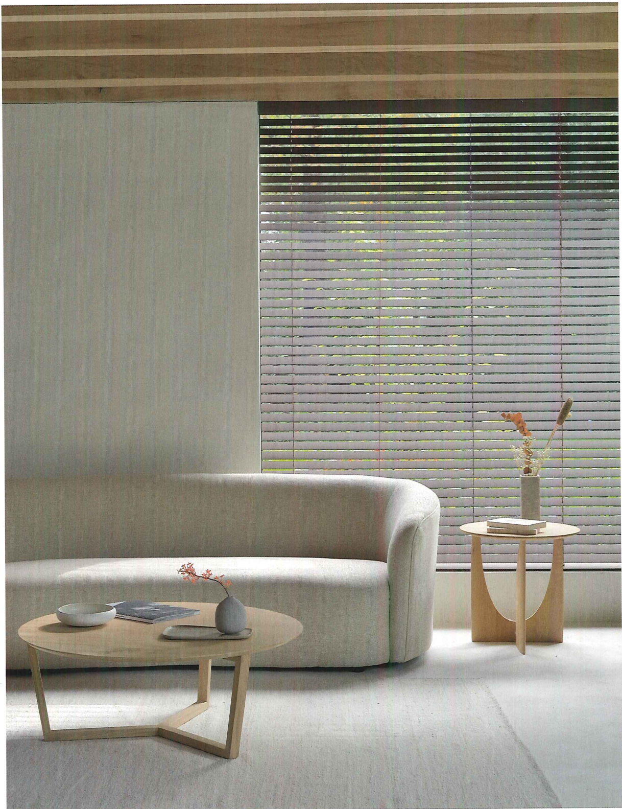
Massief eikenhout speelt bij deze ontwerpen van Ethnicraft de hoofdrol. De materiaalkeuze zorgt voor warmte en sfeer, maar het is de interactie van vormen en lijnen die voor een organisch en interessant interieur zorgen. www.ethnicraft.com Oak Bok round extendable eettafel - Oak Tripod salontafel & Oak Geometric bijzettafel ontwerp door Alain van Havre