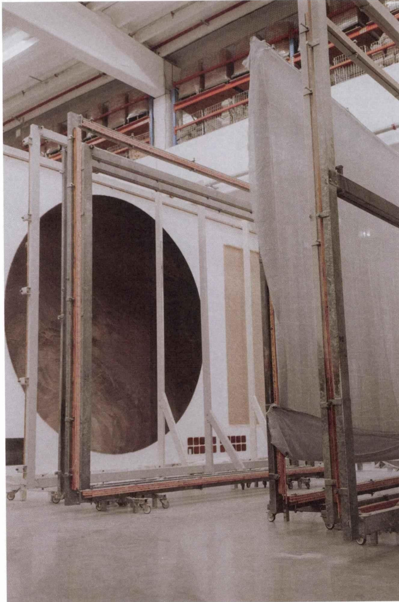
• Above: In the tufting workshop, Limited Edition

Designed as bespoke pieces, its models are designed and manufactured in Belgium, in a fully integrated process: spinning, dyeing, tufting, weaving – everything is done in-house, within the Le Tissage group. This choice of craftsmanship and industrial expertise gives the brand complete creative freedom.